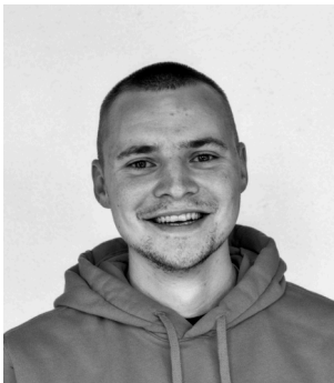
Cyrill Blaser Infrastruktur / Bau